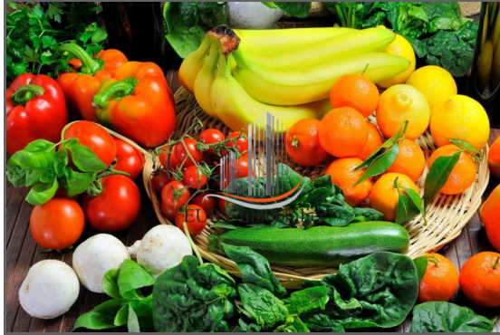
Coup de cœur